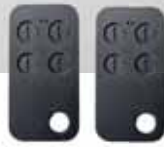
Coppia di radiocomandi 433,92/869MHz rolling-code pz/conf. 1

Universal led flashing light with integrated aerial pc/pack. 1