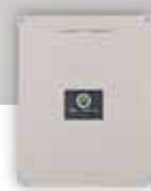
Centrale di comando pz/conf. 1

Pair of 433,92/869MHz radio control rolling-code pc/pack. 1