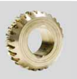
Componenti meccanici qualitativi High quality mechanical components