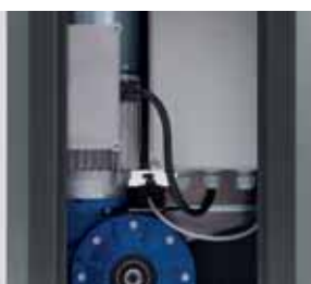
Frizione meccanica e motoriduttore Mechanical clutch and gear motor