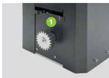
Fine corsa e ingranaggi Limit switch and gearings