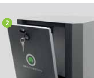
Portello di sicurezza con chiave personale Safety hatch with personal key