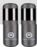
Coppia di fotocellule pz/conf. 1