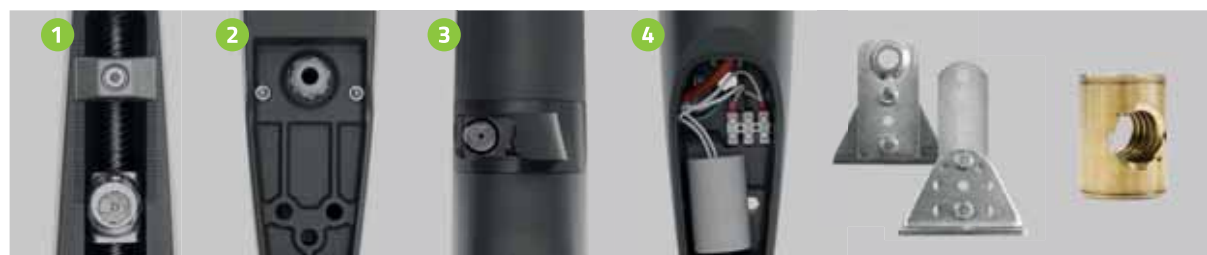
1 Fermi meccanici Mechanical stops