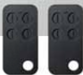
Coppia di radiocomandi 433MHz AM rolling-code pz/conf. 1

Universal led flashing light with integrated aerial pc/pack. 1