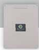
Centrale di comando pz/conf. 1

Pair of 433MHz AM radio control rolling-code pc/pack. 1