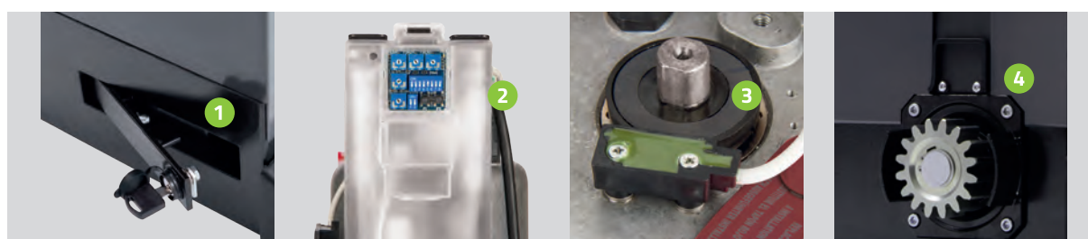
Leva sblocco con chiave personale Release lever with personal key